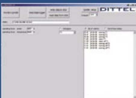
Alarm- & Warnmeldungen

Walter Dittel GmbH Erpfinger Straße 36 D-86899 Landsberg am Lech Tel.: +49 (0)8191 3351-0 Fax: +49 (0)8191 3351-49 info@dittel.com www.dittel.com